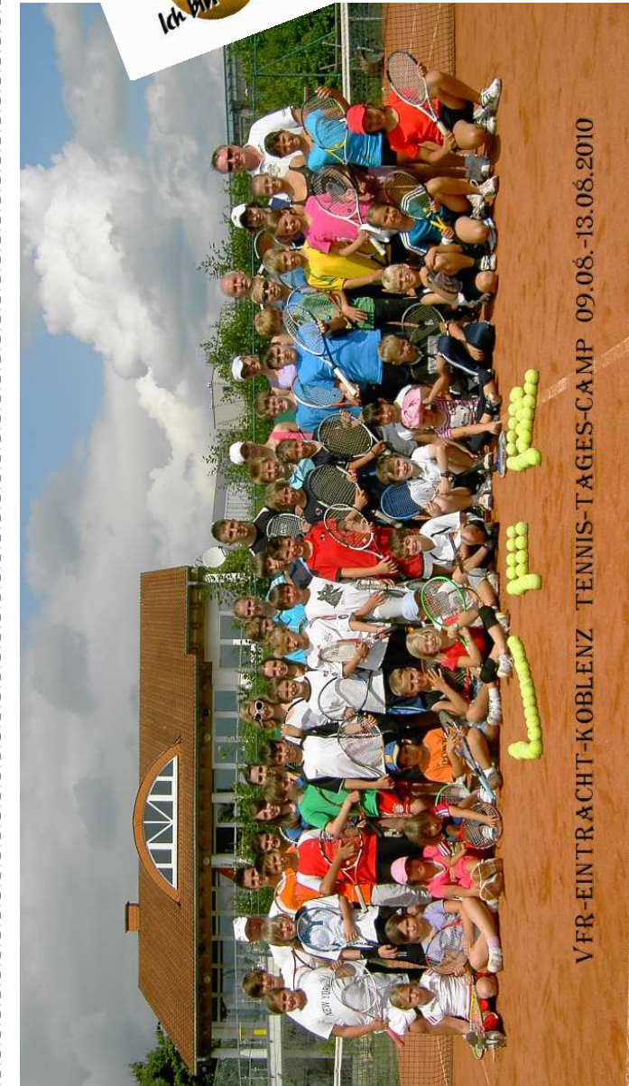
VfR-EINTRACHT-KOBLENZ TENNIS-TAGES-CAMP 09.08.-13.08.2010