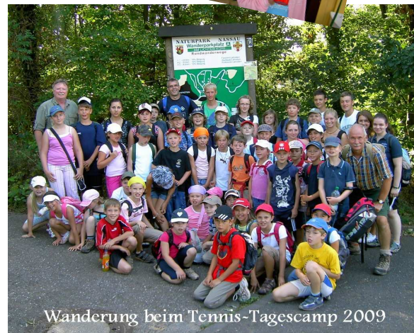
Wanderung beim Tennis-Tagescamp 2009